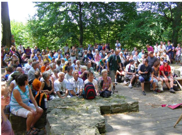
Poutníci ze všech tras se setkávají na Velehradě

Poutní společenství CMP je mnohočetné a prakticky představuje pestrost i jednotu naší