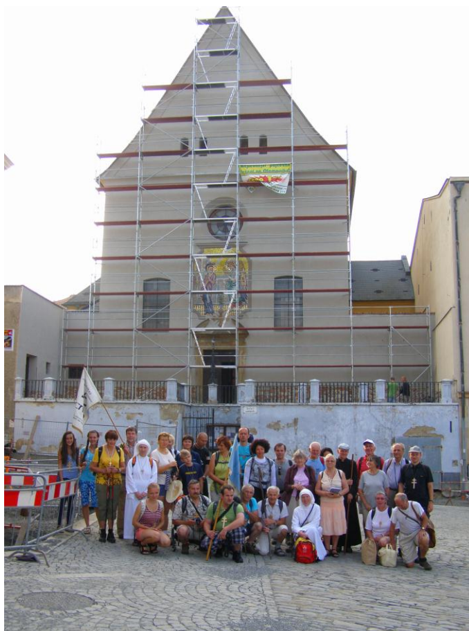
V Olomouci jsme vykročili po mši sv. od kapucínů

Při zahájení na mši svaté , kterou sloužil Bogdan Sikora OFM Conv. a koncebroval křtinský děkan Mons. Jan Peňáz se v kostele sv. Klimenta na Levém Hradci (Ubi Christianita incepta est – kde započalo v Čechách křesťanství) v sobotu 18. února tradičně sešlo více než 90 poutníků z Čech i Moravy. Bylo zde vzpomenu událostí, které zde proběhly: 19. 2. právě před 1030 roky zvolení druhého pražského biskupa sv. Vojtěcha a slavná mše sv., kterou zde o 1000letém výročí 19. února 1982 sloužil otec kardinál Tomášek a také 30. výročí zahájení této poutní tradice. Ve všech následujících nedělních etapách jsme měli možnost účastnit se mše svaté v daném místě. V závěrečných etapách z Olomouce jsme slavili mši svatou denně, díky O. Jiřímu Putalovi (z Chropině), který s námi tuto část absolvoval. A v pátek 24. srpna jsme se zúčastnili večerní mše sv. v Buchlovickém kostele sv. Martina společně s mládeží, která putovala z Vranova nad Dyjí. Během posledních etap bylo možné cestou využít doprovázející kněze ke svátosti smíření nebo k duchovním rozhovorům. A na úplný závěr doputovalo do velehradské baziliky 460