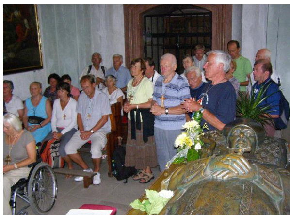
Závěr pouti u hrobu arcibiskupa Stojana