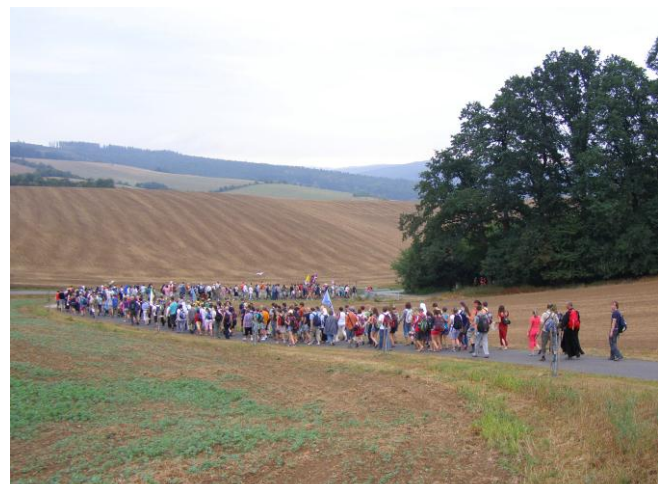
Poutníci na posledním kilometru před Velehradem

Fyzická námaha je nedílnou součástí putování. V průběhu cesty jsme si „užili“ všeho – krásného