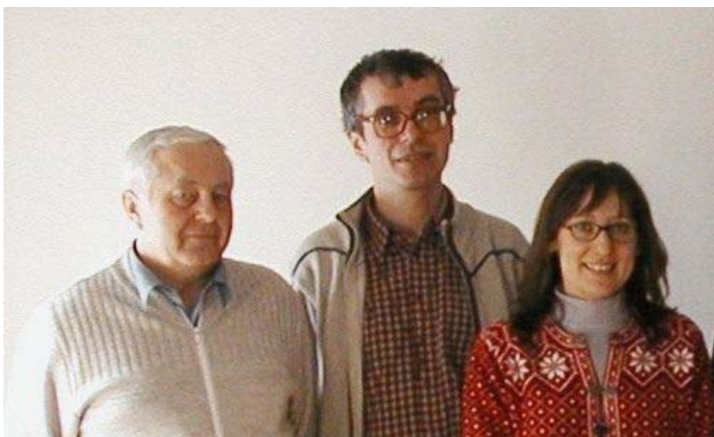
Foto ze zasedání Národní rady SFŘ 5.3.2005 v klášteře kapucínů v Brně.

Vydává NR SFŘ, adresa sekretariátu: Národní rada Sekulárního františkánského řádu, Kapucínský klášter, Kapucínské nám. 5, 602 00 Brno, email: Jiri.Zajic@adam.cz , http://www.sfr.cz ; číslo účtu: 189969375/0300